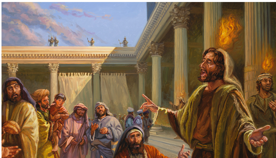
«Pentecost, the outpouring of the Holy Spirit» malt av Jan van't Hoff

Slik er Faderen Gud, Sønnen Gud, Den hellige ånd Gud, og likevel er det ikke tre guder, men én Gud.