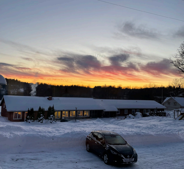
Utsikt fra matsalen på Fossnes