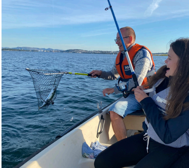
Skoletur med bibelskolen

– Det burde være obligatorisk for kristne ungdommer å gå på bibelskole. I dag vil en i større og større grad oppleve å bli stående alene som kristen, gjerne blant mennesker med lite kunnskap og forståelse for kristen tro.