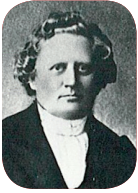
Carl Olof Rosenius