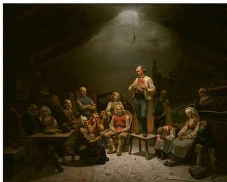
Adolf Tidemand: «Haugianerne»

Hauge satt mer enn 10 år til sammen i fengsel, riktignok med enkelte lempelser på slutten, som gjorde at han