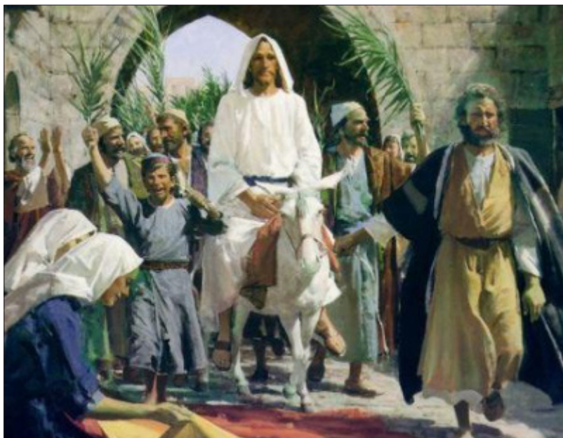
«Inntoget i Jerusalem»

Men å la søndag etter søndag, år etter år, svinne hen uten å se Kristus, er en farlig sak for hver den som lever i forsamlingen, der Kristus er og handler gjennom nådemidlene med hver sjel som vil se ham med troens øye. Det er det samme som å forspille frelsens tid og gjøre all Guds nåde forgjeves. Derfor vil vi si med alt troens alvor og med all kjærlighetens bekymring til hver vantros sjel: Gni den dorske, sløve, likegyldige, egenrettfærdige og hovmodige vantros søvn av dine øyne! La deg nå frelse så Kristus kan lyse for deg! Se, din konge kommer til deg, saktmodig!