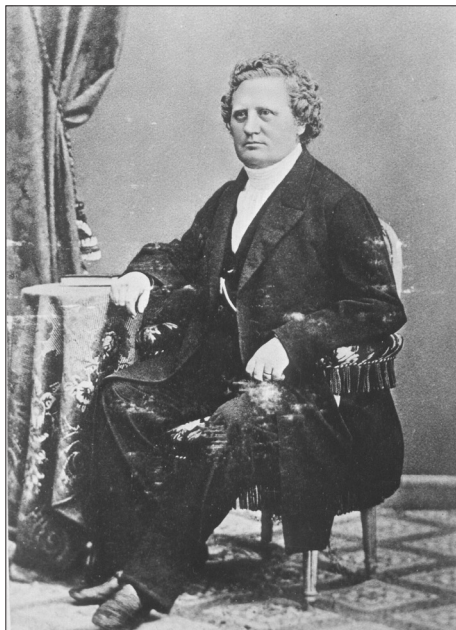
Carl Olof Rosenius 1816-68

I 19. årgang av «Pietisten» begynte Rosenius utleggelsen av Romerbrevet. Han forberedte seg ved å lese gjennom