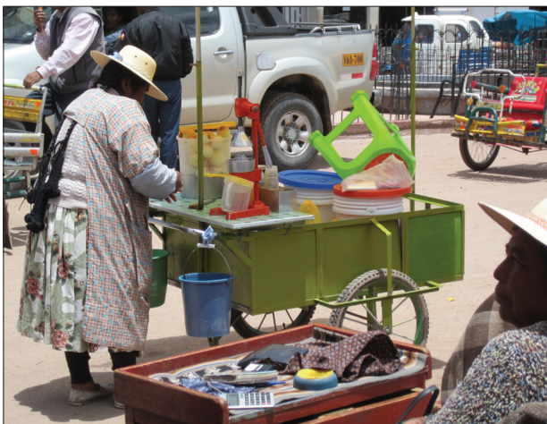
Det var mulig å kjøpe saft på grensen...