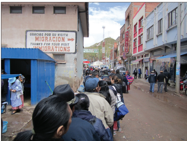
Grensepasseringen tok over én og en halv time.

passeringen, og skifte av buss i byen Puno i Peru. Der rakk vi så vidt å flytte over bagasjen i ny buss. Til nå hadde reisen foregått i en høyde av 3 800 til 4 000 m, men etter at vi passerte byen Juliaca vel en time senere, begynte oppstigningen over Andesfjellene. Noen