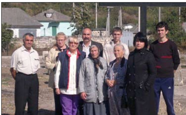
Medlemmer fra forsamlingen i Kamenka