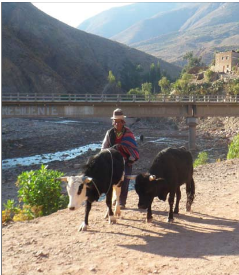
Tinguipaya, Bolivia.

«Be derfor høstens herre at han vil drive arbeidere ut til sin høst» Mat 9:38