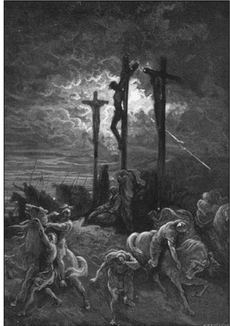
Gustave Doré: «Far, i dine hender overgir jeg min ånd!»

Jo, det var én ting som ikke hadde bristet for Jesus; én ting holdt ennå: Selv fra dødsrikets dyp kunne han si: Min Gud. «Min Gud, min Gud!» Gud hadde forlatt ham, men han hadde ikke forlatt Gud. Båndet mellom Gud og ham var ikke skåret over. Det kunne ikke skjæres over. Det gjorde at Jesus