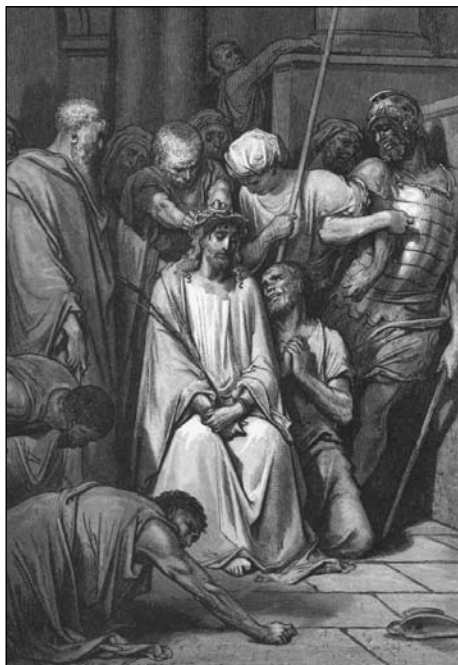
Gustave Doré: «Jesus blir tornekrønet.»

«Han utslettet skyldbrevet mot oss, som var skrevet med bud, det som gikk oss imot. Det tok han bort da han naglet det til korset.» Kol 2:14