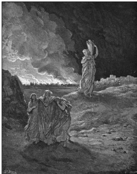
Gustave Doré: Lot flykter fra Sodom

Hvordan har han gjenløst deg? « Med sitt hellige, dyrebare blod og sin uskyldige lidelse og død ». Altså ikke med Åndens bistand og nåde, ikke med omvendelse, gjenfødelse, helliggjørelse, som er virket i deg .