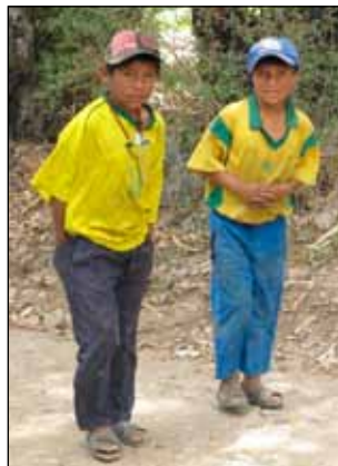
Indianergutter fra Bolivia

Vi leste et avsnitt fra Bibelen sammen: «Jesus sa da til de tolv: Vil også dere gå bort? Simon Peter svarte ham: Herre, hvem skal vi gå til? Du har det evige livs ord, og vi tror og vet at du er Guds Hellige!» (Joh 6:67-69). Vi merket Den Hellige Ånds nærvær.