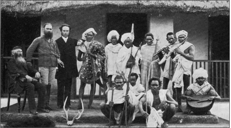
Misjonærene sammen med et santalsk jaktlag (1874)

på at vår egen kjære kong Haakon var 10 år gammel da han hørte Skrefsrud fortelle fra Santalistan. Men han hadde sikkert hørt om Santalmisjonen lenge før den tid. Hans mor, kronprinsesse, senere dronning Louise, var nemlig en varm venn av misjonen, likedan dronningen, Louise av Hessen. Enkedronningen, Caroline Amalie, som døde før Skrefsrud fikk hilse på henne, var i den grad interessert at hun til og med korresponderte med de innfødte kristne, og ved en leilighet sendte hun et gullkors besatt med ametyster som gave til en bibelkvinne. Et stort, vakkert teppe, brodert på slottet, ble sendt til misjonsstasjonen Ebenezer, og brukes den dag i dag som alterteppe ved festlige anledninger.