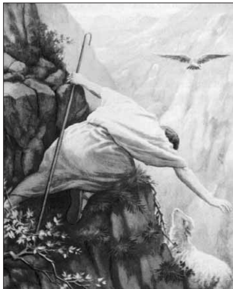
Den gode hyrde setter sitt liv til for fårene

Den gode hyrde setter sitt liv til for fårene. Det gjorde også mange profeter, de fleste apostler som til slutt «mistet hodet», for ikke å snakke om Paulus som hadde en hel katalog av