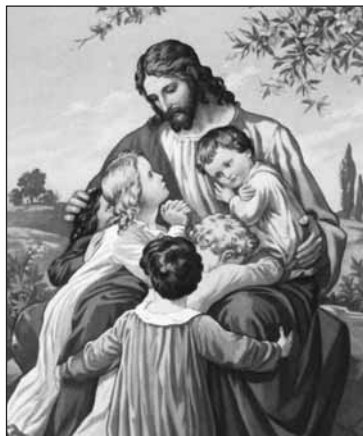
Jesus og barna

deres fullstappede med så mange gode formål at de ikke får tid til å søke kraft fra Kristus. Snart vil de arbeide bare i egen styrke, de vil ofre helsen sin og enheten i familien for den gode saken».