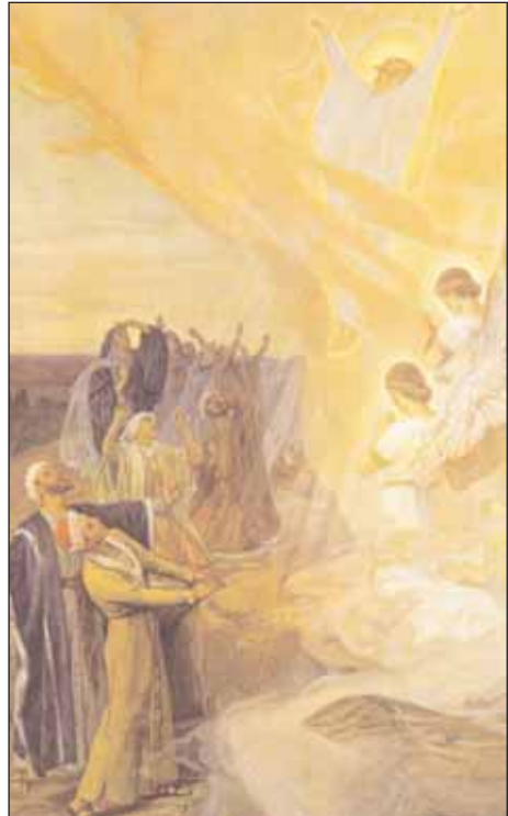
Julius Kronberg: «Kristi himmelfærd»