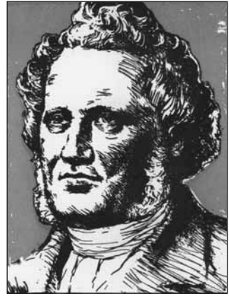
Carl Olof Rosenius

Men dette nye menneske, med dets kjærlighet til Jesus, er ikke alene i menneskehjertet. Der finnes også det gamle menneske, det som Det nye tes-