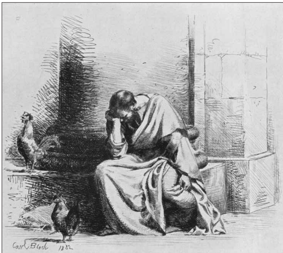
Carl Bloch: «Den angrende Peter». Radering, 1882

hans brutte løfter og dype fall, minnet Jesus om hans stakkars disippels nød. Det er den eneste gangen i hele lidelseshistorien at Jesus kalles Herren. Og i sannhet, han sto også som en herre, bundet og likevel fri, fanget og likevel sterk nok til å redde en sjel ut av djevelens snare. «Da kom Peter Herrens ord i hu, det han hadde sagt til ham: Før hanen galer to ganger, skal du fornekte meg tre ganger» (Mar 14:72). →