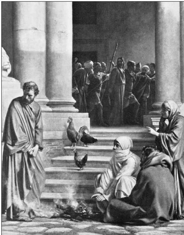
Carl Bloch: «Peters fornæktelse»

«Og Herren vendte seg og så på Peter. Da kom Peter Herrens ord i hu. (...) Og han gikk ut og gråt bittert.» Luk 22:61-62