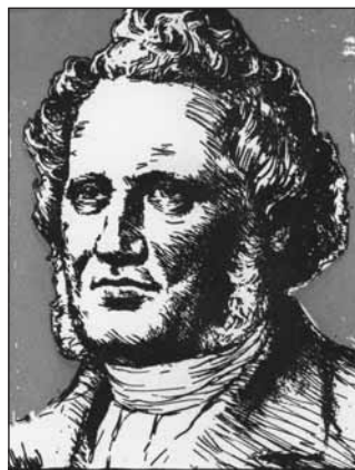
Carl Olof Rosenius

Så heter det f.eks. i en av de tidligste artiklene i «Pietisten»: «Alt menneskelig er svakt, vakkende, usikkert, omskiftende, som fornuft, følelse, tanke og omdømme» (1. årg. 1842). Slik begynner han. En undres jo om ikke en oppbyggelig artikkel med slike åpningsord har vakt motforestillinger hos en og annen av leserne. Men for Rosenius var den bibelske sannheten om syndefallet og dets følger en overmåte viktig sak, som forkynneren og sjelesørgeren ikke måtte tie om. Gang på gang vender han tilbake til dette. I årgangen 1851 kommer en rekke artikler med slike overskrifter: