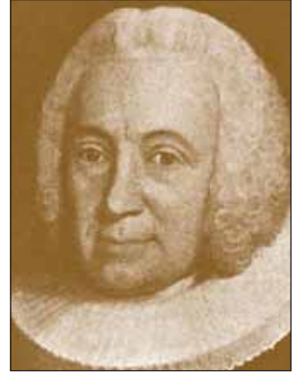
Hans Adolph Brorson

Brorson selv knytter et bibelord til denne salmen – som en overskrift. Det er ordet fra Herrens engel til hyrdene på marken i Luk 2:12: «Og dette skal