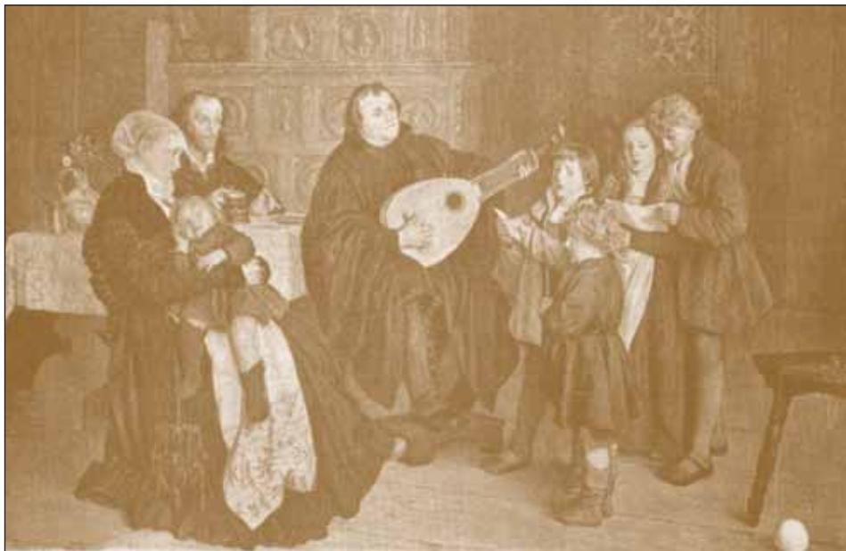
Luthers familie med vennen Melankton

Gi nøye akt på dette tegn: I krybben svøpt, i stallens hegn, der finner dere barnet lagt som bærer verden med sin makt.