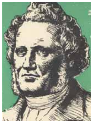
Carl Olof Rosenius

Hedberg vil at en skal holde seg bare til det skrevne Ordet uten å hefte seg med selvprøvelse og troens kjennetegn. Men da blir Rosenius redd for at troen bare skal bli en forstandssak. Han vet at den sanne tro er vel kjent med anfektelsen. Om og om igjen skriver han til Hedberg om dette: