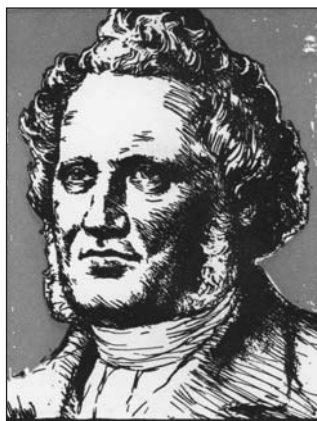
Carl Olof Rosenius