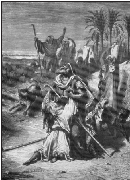
Gustave Doré: Den bortkomne sønn ble møtt av sin far

himmelen som har skapt deg i sitt bilde og som du skal stå til regnskap for innfor hans trone, er det ikke redelig