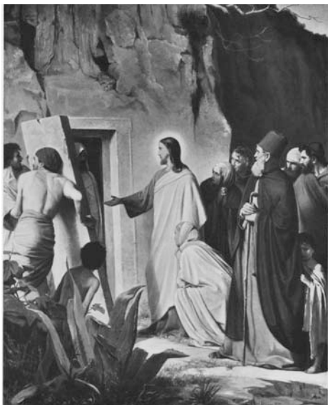
«Kristus oppvekker Lasarus» av Carl Bloch, 1870.

Disiplene så Underet i Jesu undergjerninger og skjønte at han var den lovede Messias