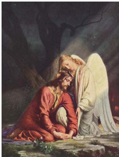
«Kristus i Getsemane» av Carl Bloch. Forarbeid til altertavlen i Odense, malt 1878-79

Han er det største under i tilværelsen. →