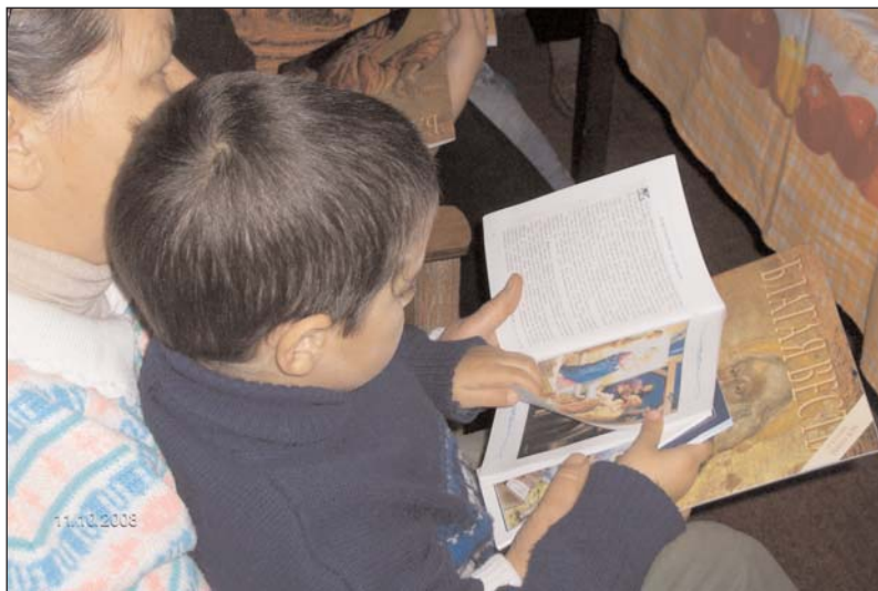
Boken «Min første reise gjennom Bibelen», nå på russisk