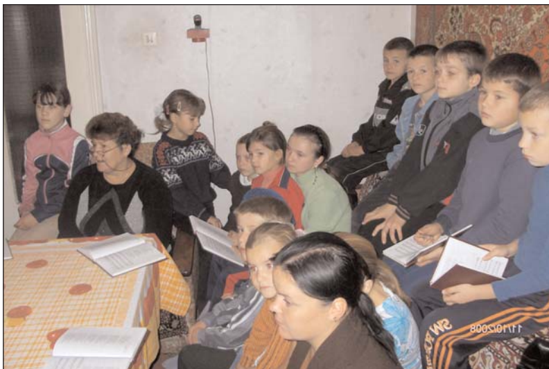
Katekisme- under- visning i Karmanova

fra Tiraspol og Luthersenteret tar nesten to timer.