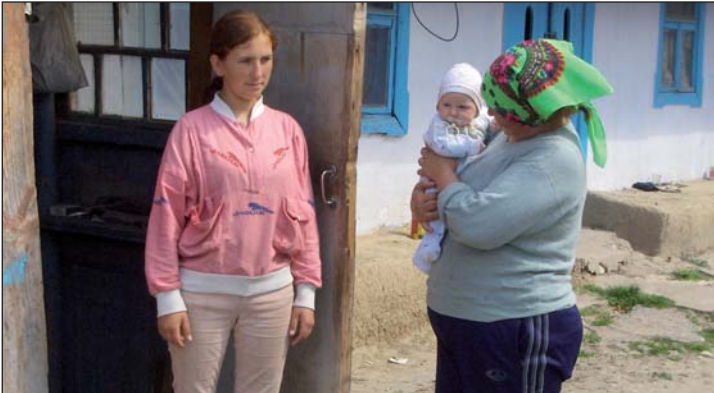
Fattig familie i Moldova som har fått mat og klær fra hjelpesending

Vennligst gi ekspedisjonen beskjed i god tid ved adresseforandring!