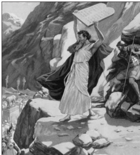
Moses knuser steintavlene

Då er det godt å sjå kva Moses, som førebilete på Jesus, bad om. Vi las at han var i bøn for alt folket «på grunn