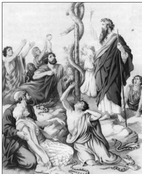
Kobberslangen i ørkenen

Vi merker oss også at her var det troen på og tilliten til Herren som var det avgjørende. Dette skulle alltid ha vært grunnholdningen i vårt forhold til Gud, slik Herren også forkynner det ved profeten Jesaja senere: «Vend dere til meg og bli frelst, alle jordens ender! For jeg er Gud, og ingen annen» (Jes 45:22). Frelsen har alltid bestått i å vende seg til Herren, altså ved å tro. Hos profeten Habakkuk (2:4) heter