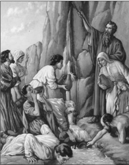
Moses slår på klippen

Moses sviktet også ved at han slo to ganger på klippen for å få vann. Herrens befaling var jo ikke at han skulle slå på klippen. Han skulle tale til den. Moses og Arons opptreden gjør at folkets oppmerksomhet blir rettet på dem