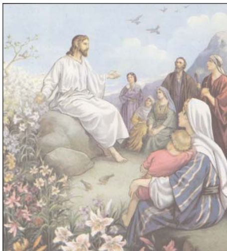
Jesus forteller om himmelen.

«Det spørsmålet er ikke lett å svare på, gutten min,» sa far. «Det står i bibelen om Gud: «...fra evighet og til evighet er du, o Gud» (Sal 90:2). Og om oss står det at den som tror på Jesus, skal arve evig liv . Det er vanskelig for oss å tenke oss noe som varer bestandig – som aldri tar slutt.