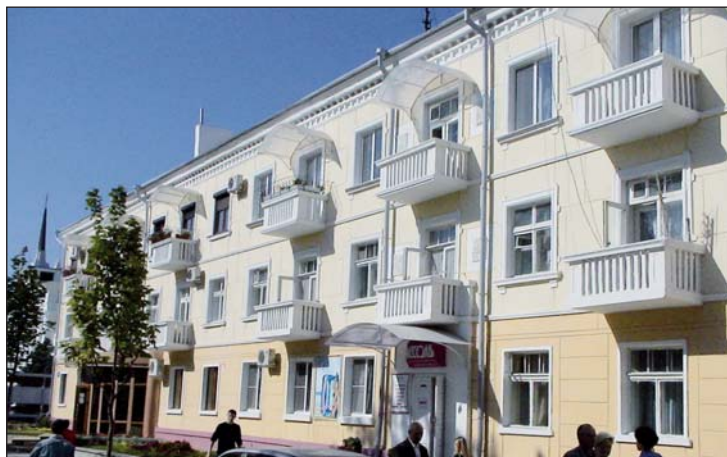
Luther-senteret ligger midt i tredje etasje.