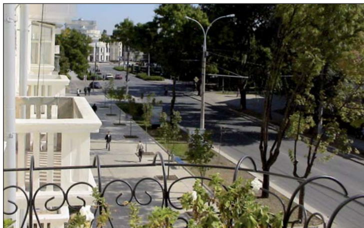
Utsikt fra Luther-senteret i Tiraspol.