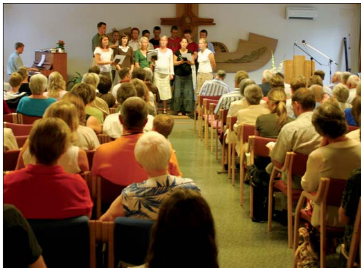
Fra sommer- skolen på La- berget 2006.