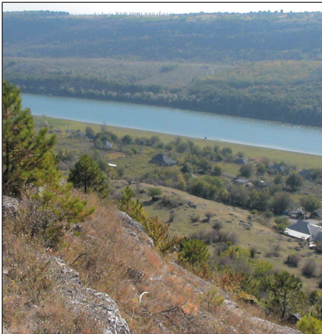
Utsikt over elva Dnestr og Moldova.

Så er vi i Kamenka, for å forkyne ham som ble født i Betlehem for over 2000 år siden. Vi kommer frem til bestemmelsesstedet, og går opp trappene til 5. etasje, øverste etasje i en av byens boligblokker. Her møter jeg datteren i huset som ønsker oss velkommen på