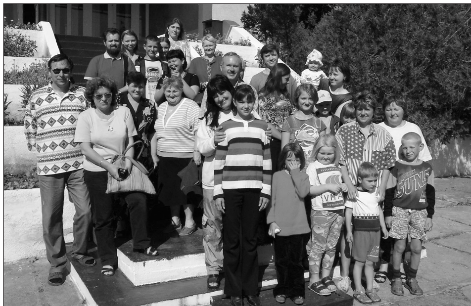
Menigheten fra kirken i Moldova samlet til sommerskole, juni 2004.

flyplassen den siste søndagen. Det var rørende å se hvor glade de var for å samles, og ikke minst over å få besøk av Moser.